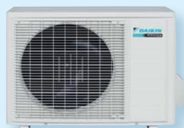
RXG 25 K