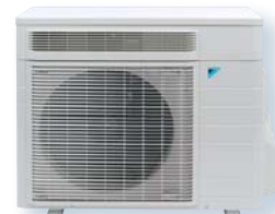
RXR 50 E