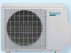
2 AMX 40 F