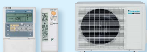
RXS 25 J