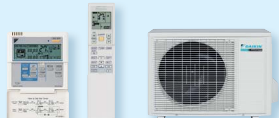
RXS 25 J