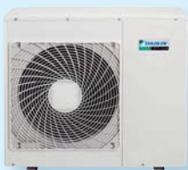
RXS 71 F